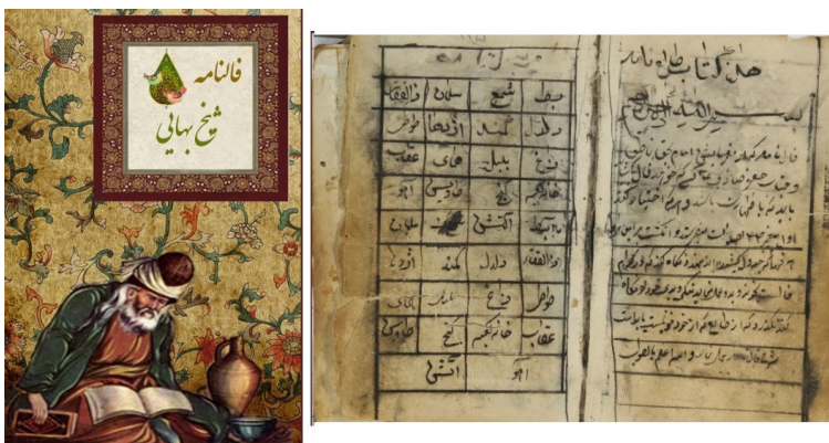
شکل ۱: فالنامه شیخ بهائی

برد. در سال ۲۰۰۹، یونسکو برای گرامیداشت خدمات شیخ بهایی به علم ستاره شناسی نام او را به فهرست مفاخر ایران افزود.